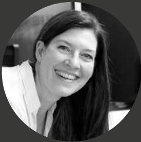
Christina Konzeption + Kreation

Headquarter: seit 2006 in Mettmann-Obschwarzbach